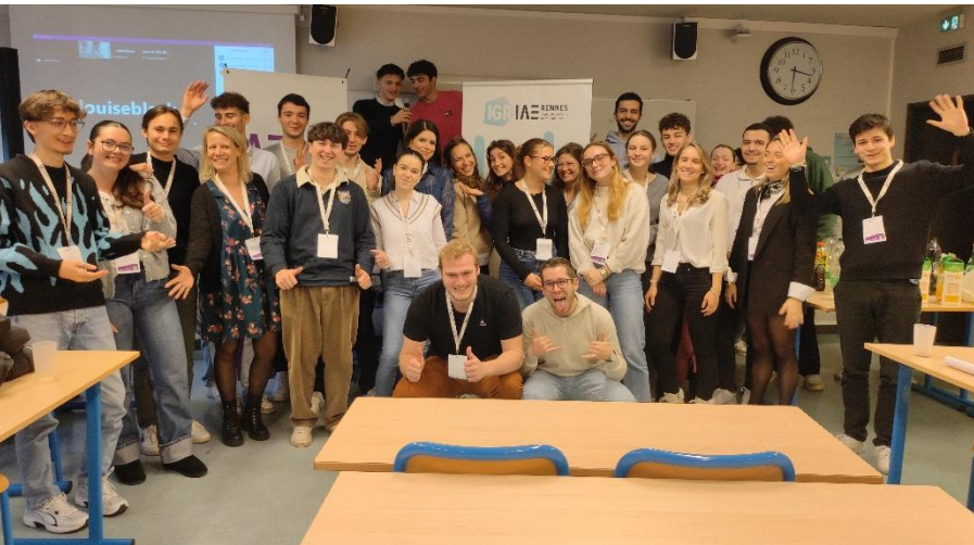
Rencontre IAE FRANCE PARTNER 2024 Novembre 2024 (IGR-IAE Rennes)